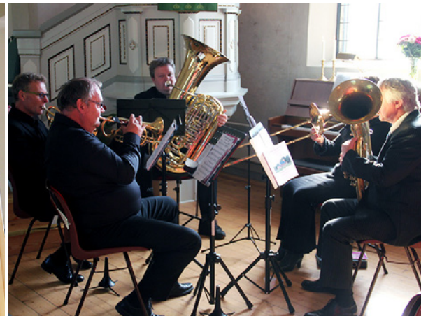
Kvintett fra Tistedalen Musikkforening.

denne kirken ble bygget, og på forholdene i og rundt Tistedal for 150 år siden. Folk strømmet til tettstedet fra landsbygda for å få arbeid i den voksende industrien. Mye fattigdom og sykdom blant mange som bodde trangt i relativt dårlige hus. Periodevis koleraepidemier.