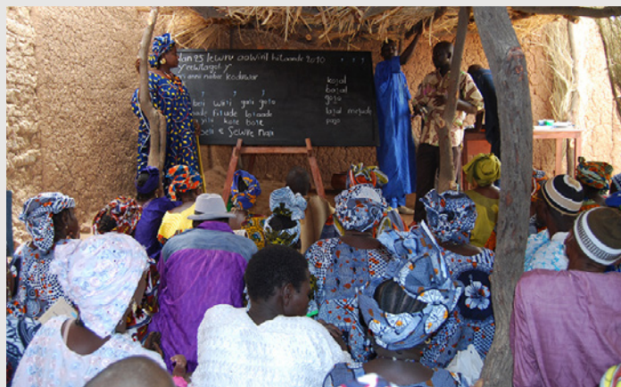
Lese- og skrivekunnskaper bidrar til verdig liv. Mali.