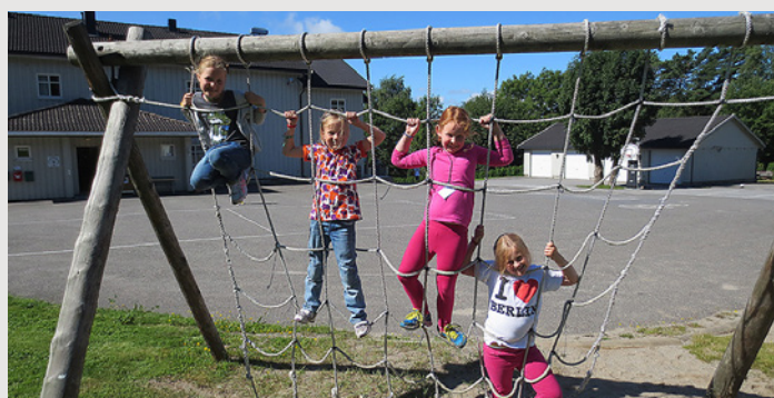
Globusagenter – ett av NMSU's leirtilbud på Stenbekk Misjonssenter.

god støtte for kristne minoriteter i området. De bidrar også til å fremme fred og forsoning gjennom sine programmer. Den siste tiden har de sendt skole-TV-programmer for syriske flyktningbarn.