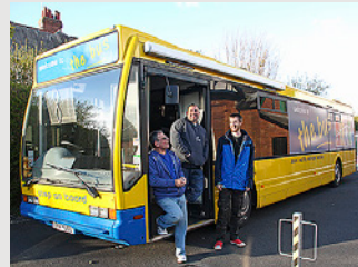
«The Bus» er et av kirkens lavterskeltilbud for å komme i kontakt med ungdom i Carlisle bispedømme. England.

I Norge har NMS ca. 2000 foreninger – fire av dem i Halden. Mer enn 550 av Den norske kirkes menigheter har en samarbeidsavtale med NMS om å støtte et misjonsprosjekt. Berg og Rokke menigheter er blant dem. NMS driver også 47 Gjenbruksbutikker og 13 leirsteder. I Østfold er det Stenbekk Misjonssenter som er «NMS' storstue». Der arrangeres det leirer for barn og unge hele året. Det er også mange arrangement for voksne. I tillegg til